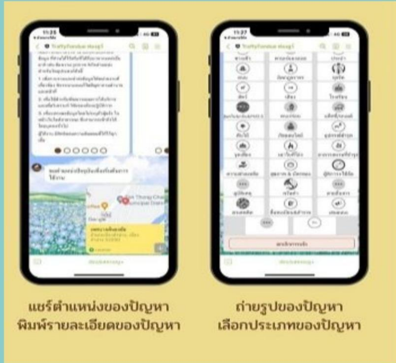
แชร์ตำแหน่งของปัญหา พิมพ์รายละเอียดของปัญหา